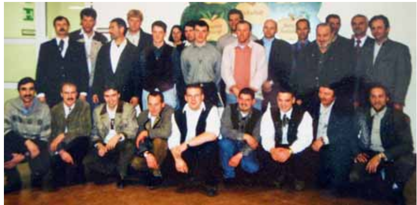
BBS Forst 2001/02