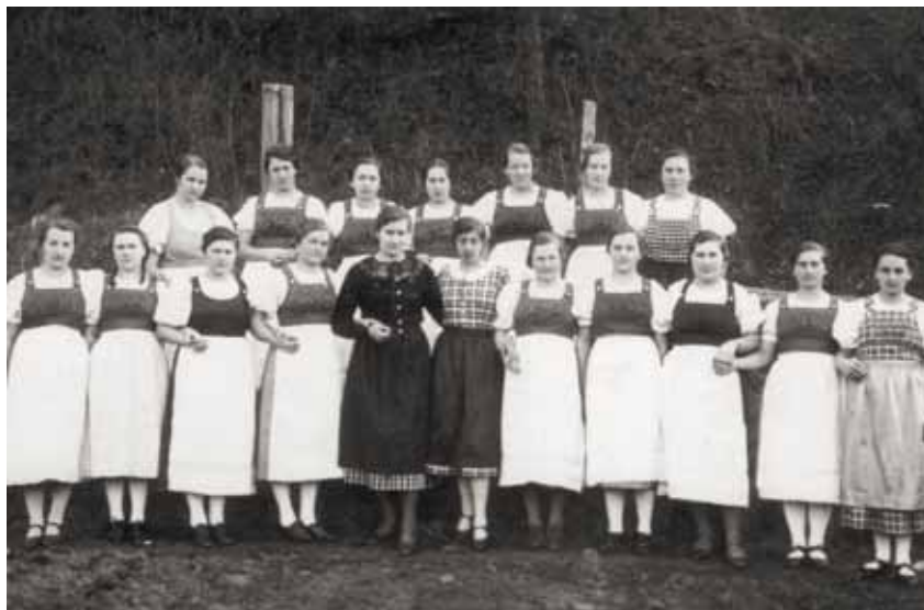
14. Abschlussjahrgang Mädchen, 1937/38