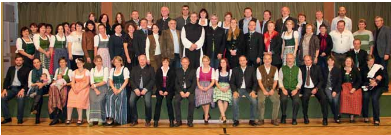
Lehrer und Bedienstete der LFS Warth im Jahr 2014