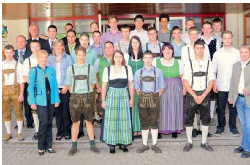
Abschlussjahrgang LW 2012