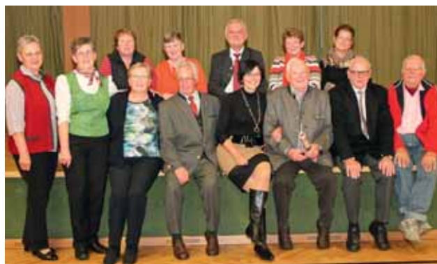
Ehemalige Lehrer und Bedienstete der LFS Warth im Jahr 2014