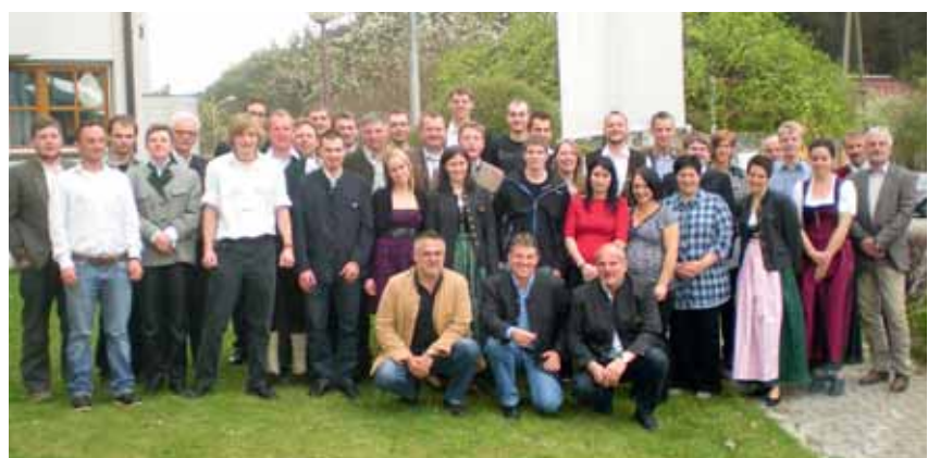
BBS LW 2010/11