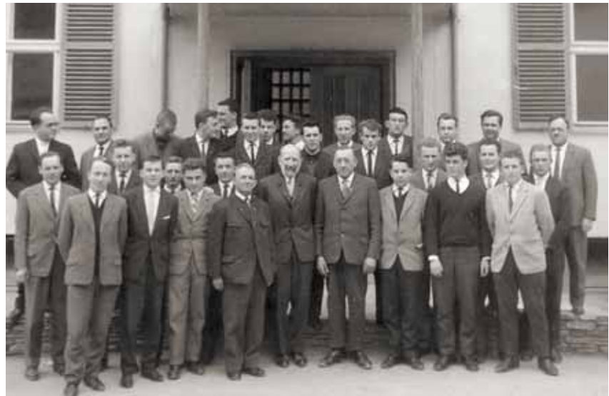
Abschlussjahrgang mit Lehrkörper 1962