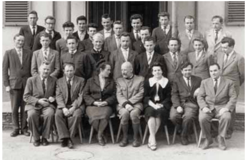
Abschlussjahrgang mit Lehrkörper 1961