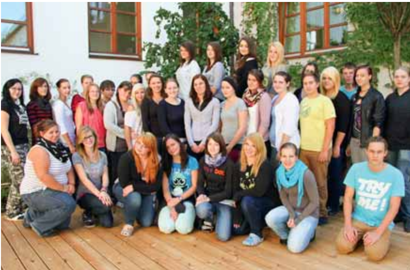
Abschlussjahrgang HW 2014