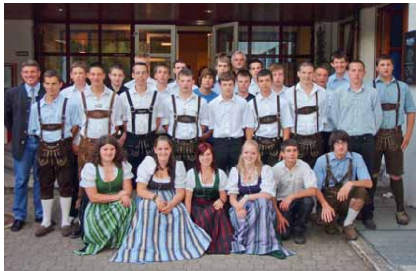
Abschlussjahrgang LW 2010