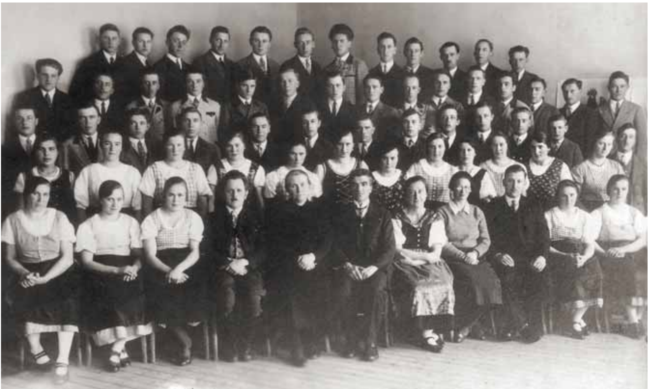
Alle 1. u. 2. Jahrgänge Burschen und Mädchen, 1933/34