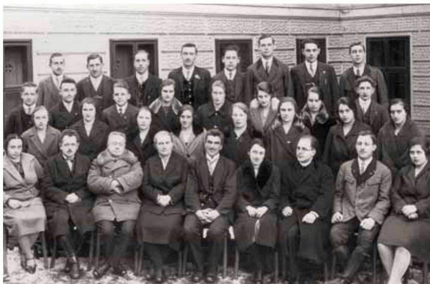
Beide Abschlussjahrgänge gemeinsam, 1930/31