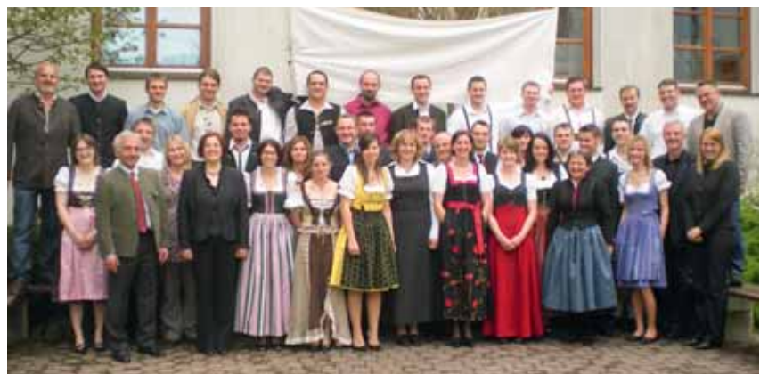
BBS LW 2009/10