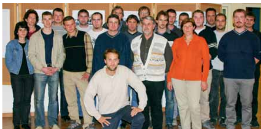
BBS Forst 2004/05