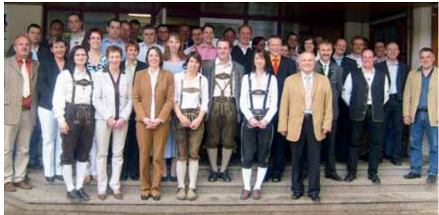
BBS LW 2007/08