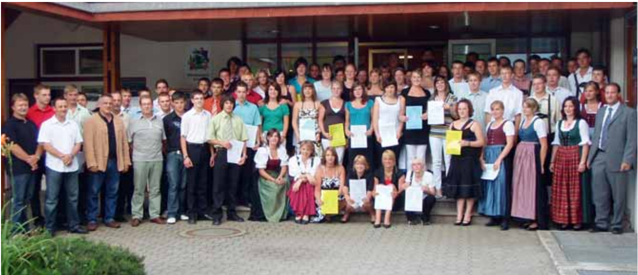
Alle Absolventen 2008