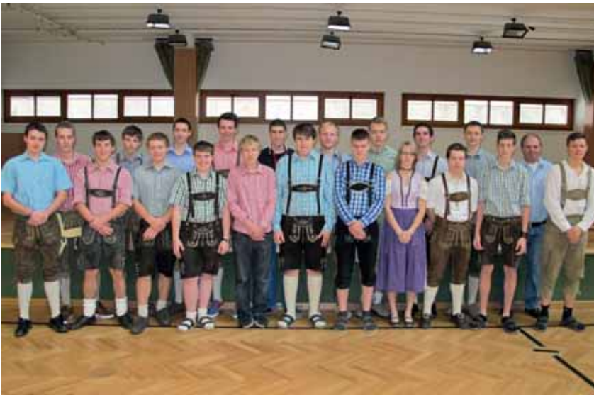
Abschlussjahrgang LW 2014