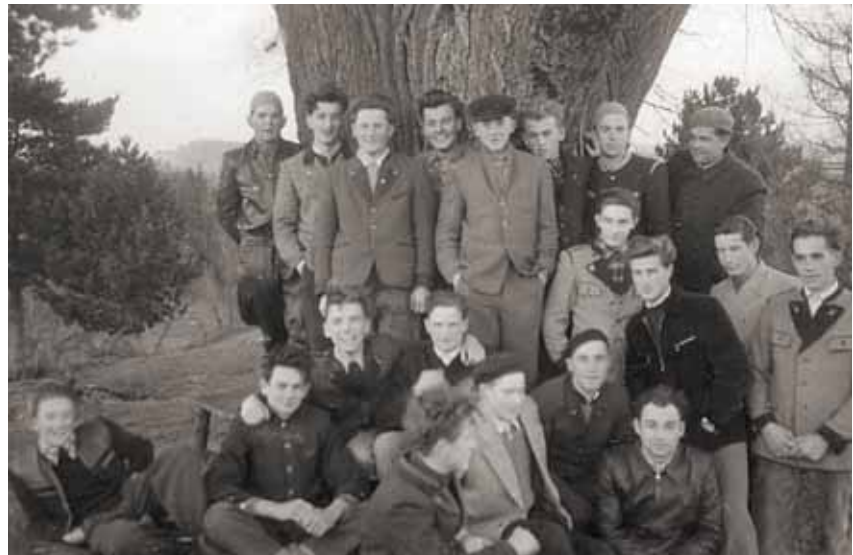
Abschlussjahrgang 1957 (Foto vom Herbst 1956)