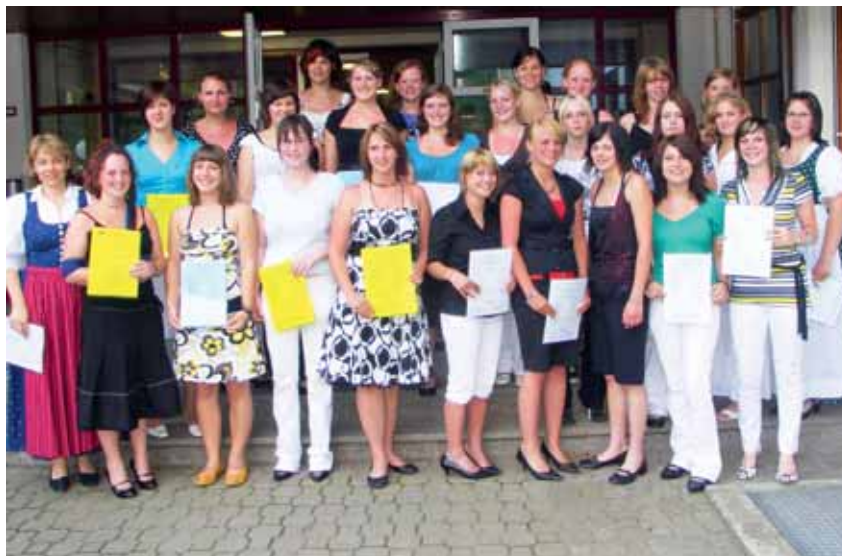
Abschlussjahrgang HW 2008