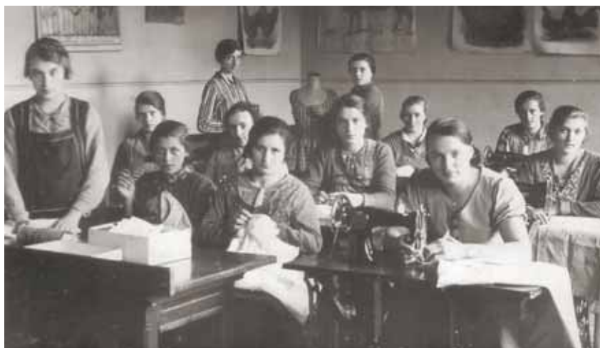
Mädchen im Nähunterricht, 1934/35