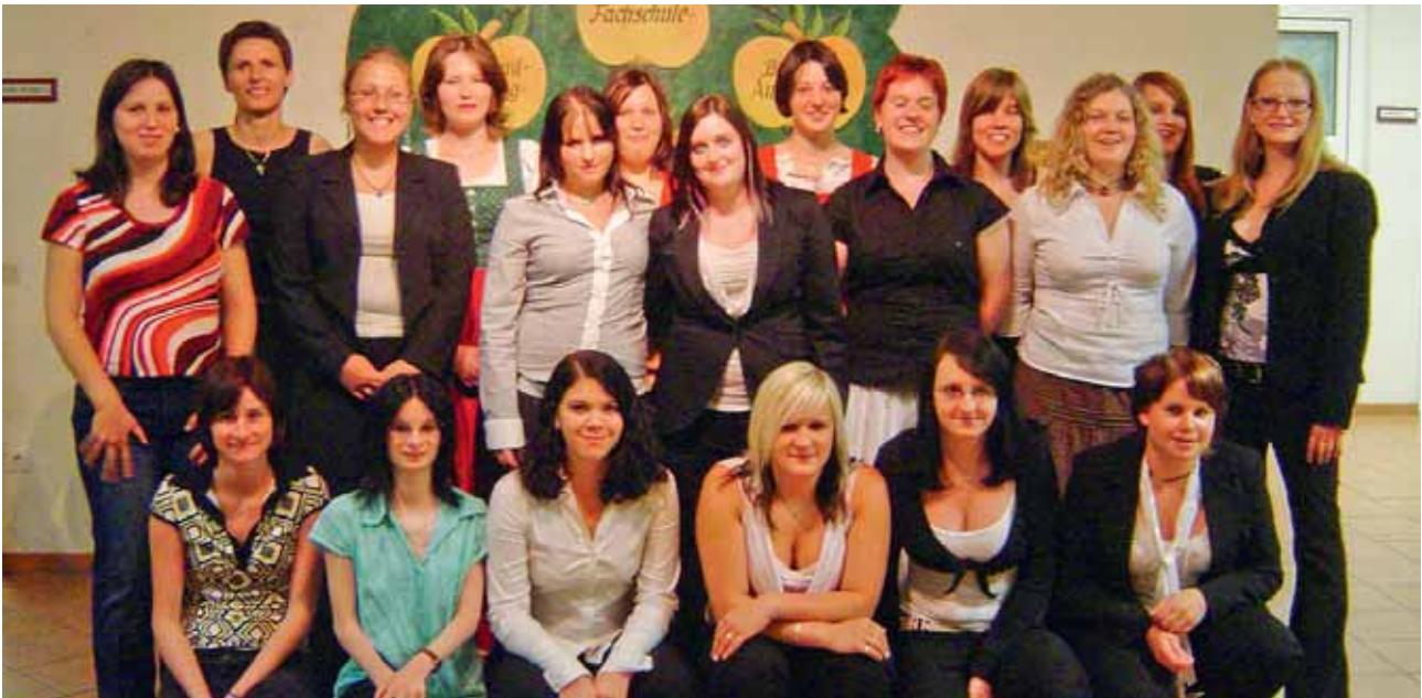
1. Abschlussjahrgang HW 2007