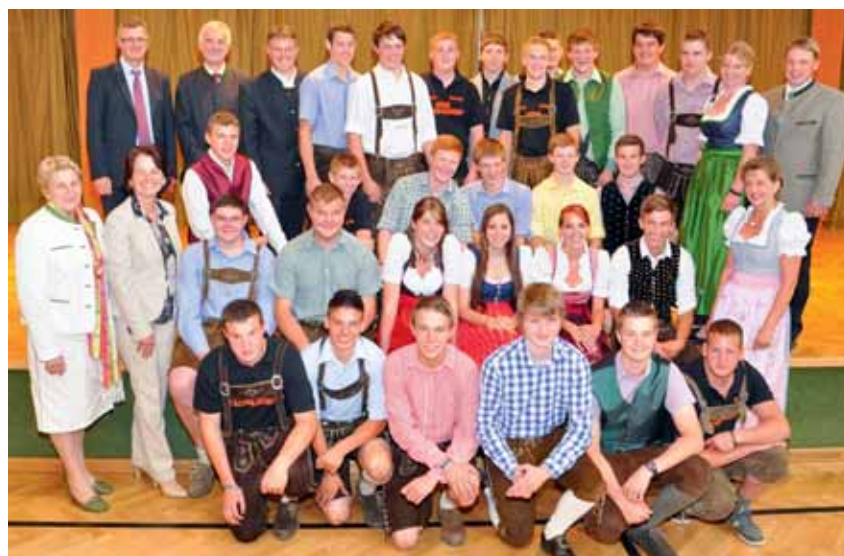
Abschlussjahrgang LW 2013