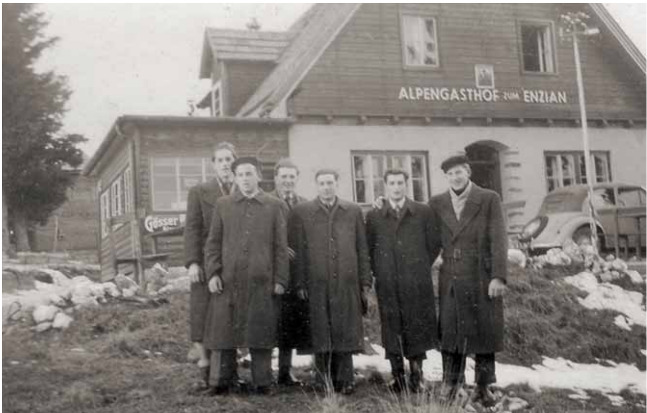
1. Jahrgang 1954/55

Von einigen Jahrgängen sind leider keine Fotos mehr vorhanden!