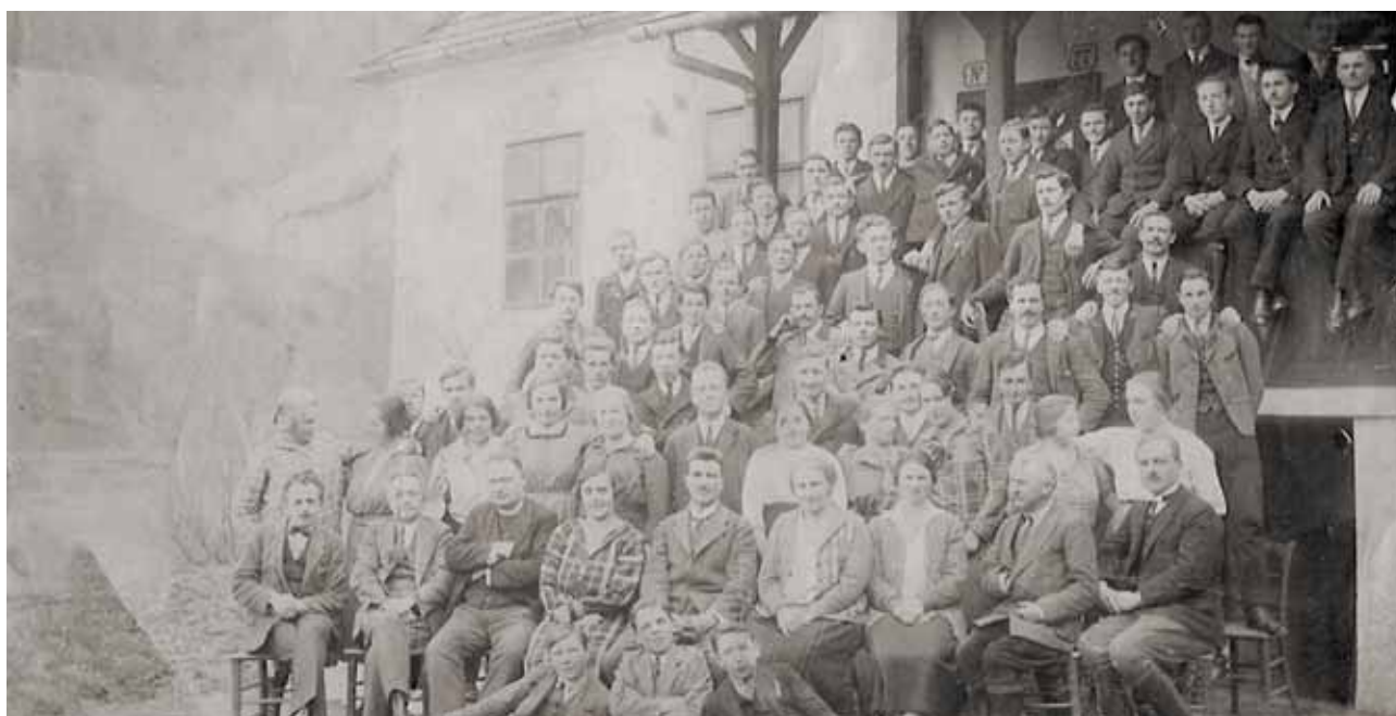
Alle 1. u. 2. Jahrgänge Burschen und Mädchen im Schuljahr 1925/26, erstmals 3 Klassen (vor Schul-Nebengebäude Hausnr. 77)