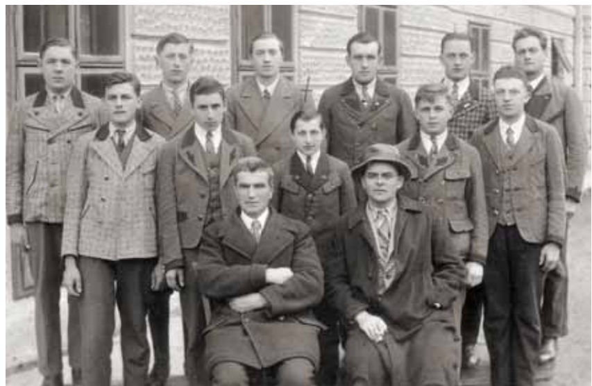
13. Abschlussjahrgang Burschen, 1936/37 (nur mehr einsemestrig)