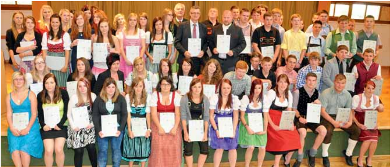
Alle Absolventen 2013