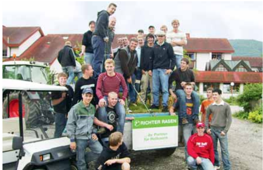
Abschlussjahrgang LW 2007