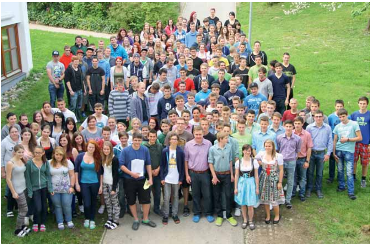
Alle Schüler der LFS Warth im Jahr 2014