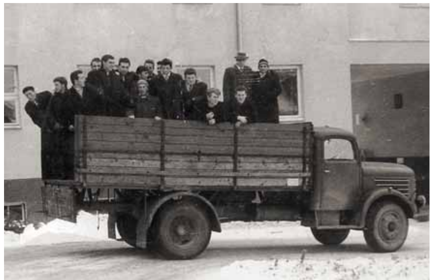
Abschlussjahrgang auf Moldwoche 1963