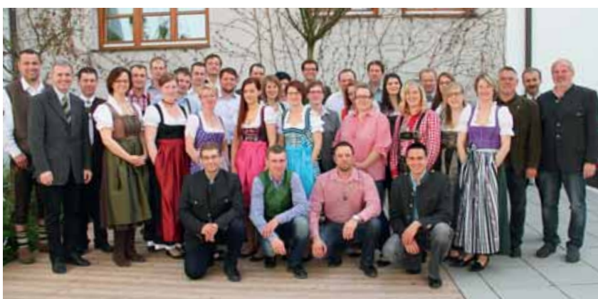
BBS LW 2013/14