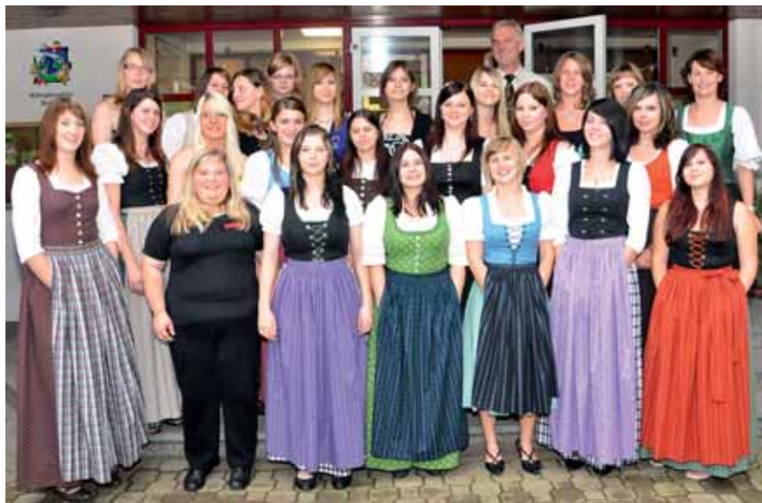
Abschlussjahrgang HW 2009