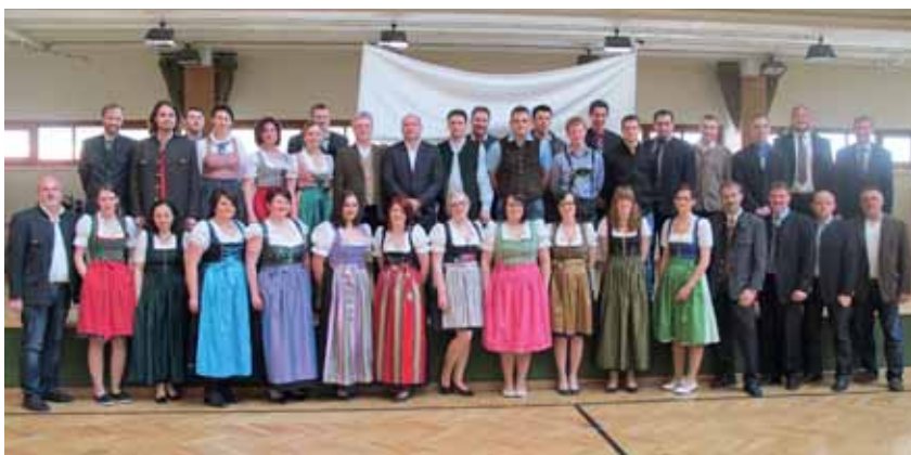
BBS LW 2012/13