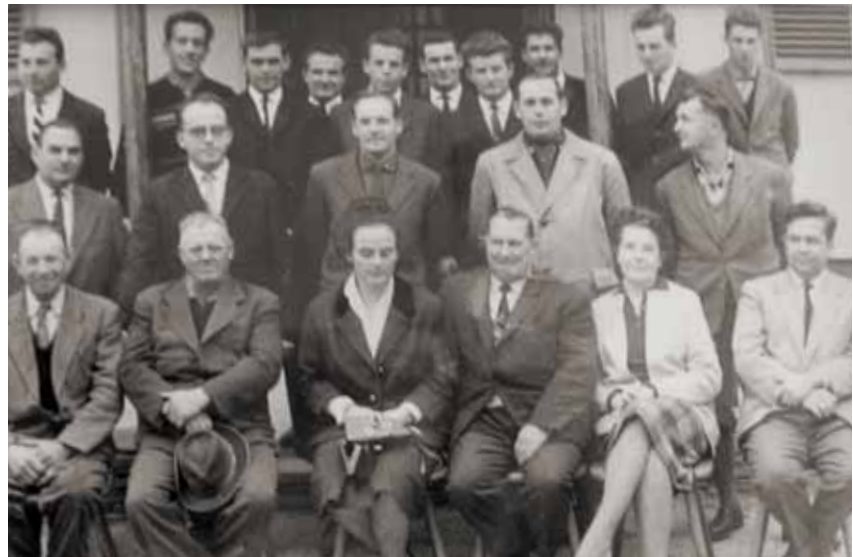
Abschlussjahrgang im Herbst beim Facharbeiterabschluss 1963