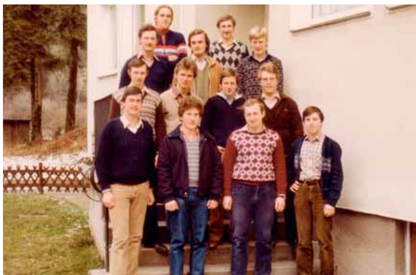
LBS 1980/81 II