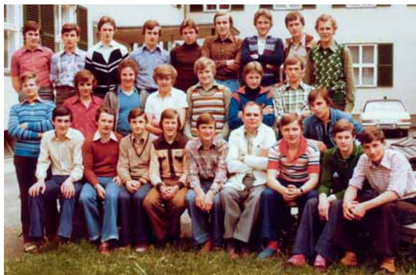
Abschlussjahrgang 1980 (Foto v. 1978)