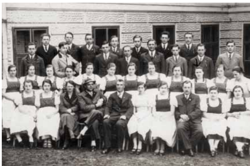
Beide Abschlussjahrgänge gemeinsam, 1937/38