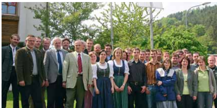
BBS LW 2005/06