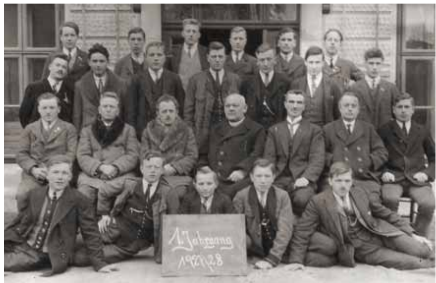
4. Abschlussjahrgang Burschen, 1928/29 = 1. Jahrgang 1927/28