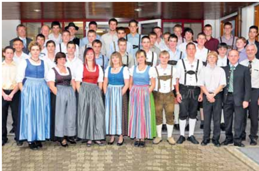
Abschlussjahrgang LW 2009