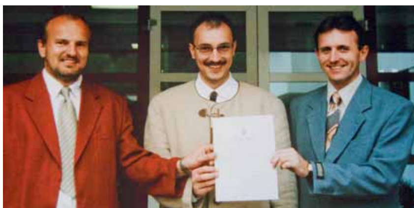
BBS LW 1997/98