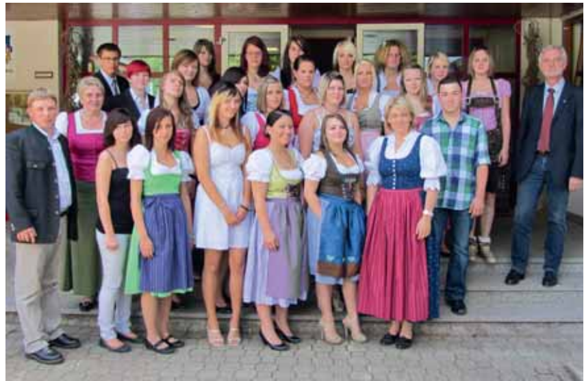
Abschlussjahrgang HW 2011