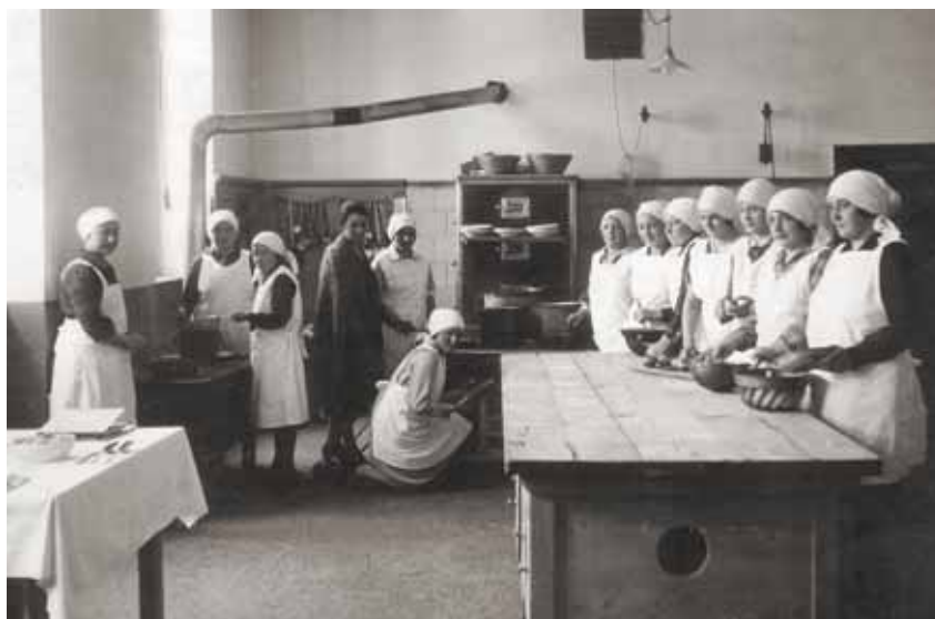
5. Abschlussjahrgang Mädchen, 1928/29 (in der Schulküche 1928)