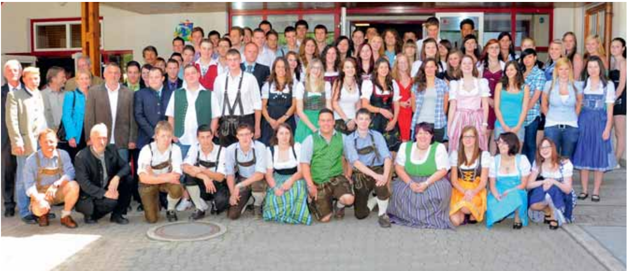
Alle Absolventen 2012