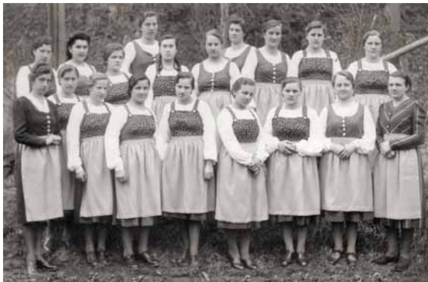
17. und letzter Abschlussjahrgang Mädchen, 1940/41