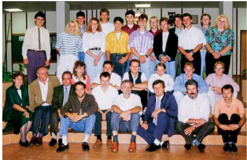
Abschlussjahrgang mit Teil des Lehrkörpers 1993