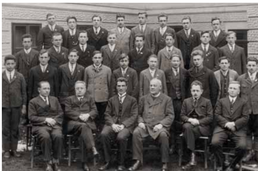
5. Abschlussjahrgang Burschen, 1929/30