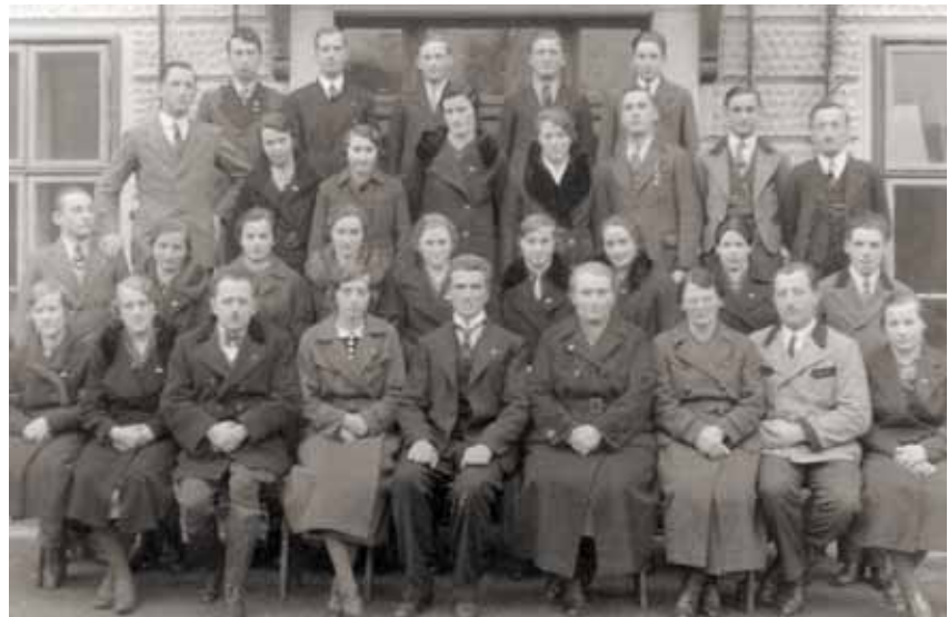
Beide Abschlussjahrgänge gemeinsam, 1935/36