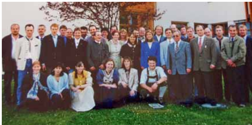
BBS LW 1997/98