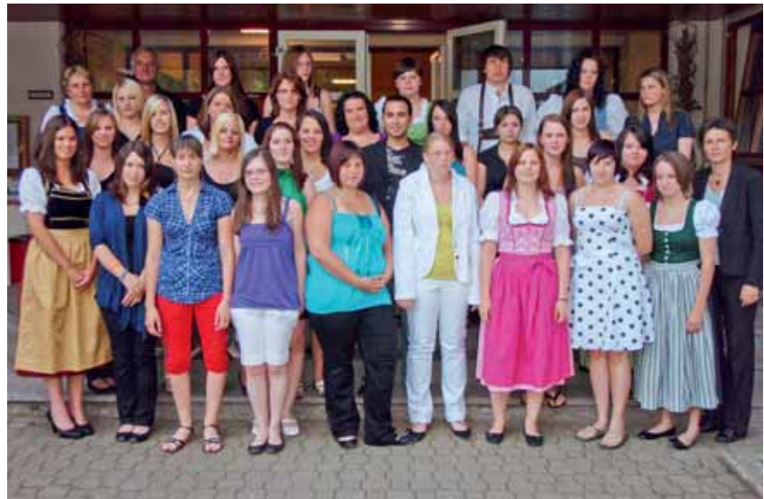
Abschlussjahrgang HW 2010