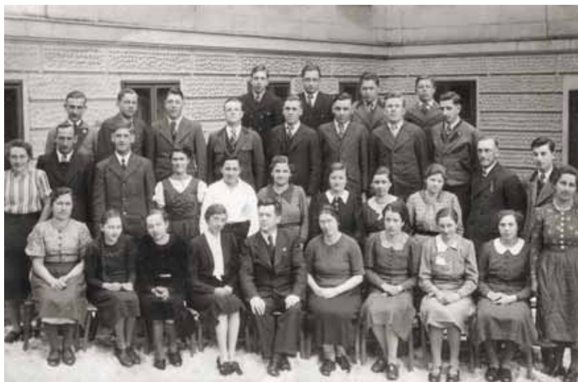
Beide Abschlussjahrgänge gemeinsam, 1939/40