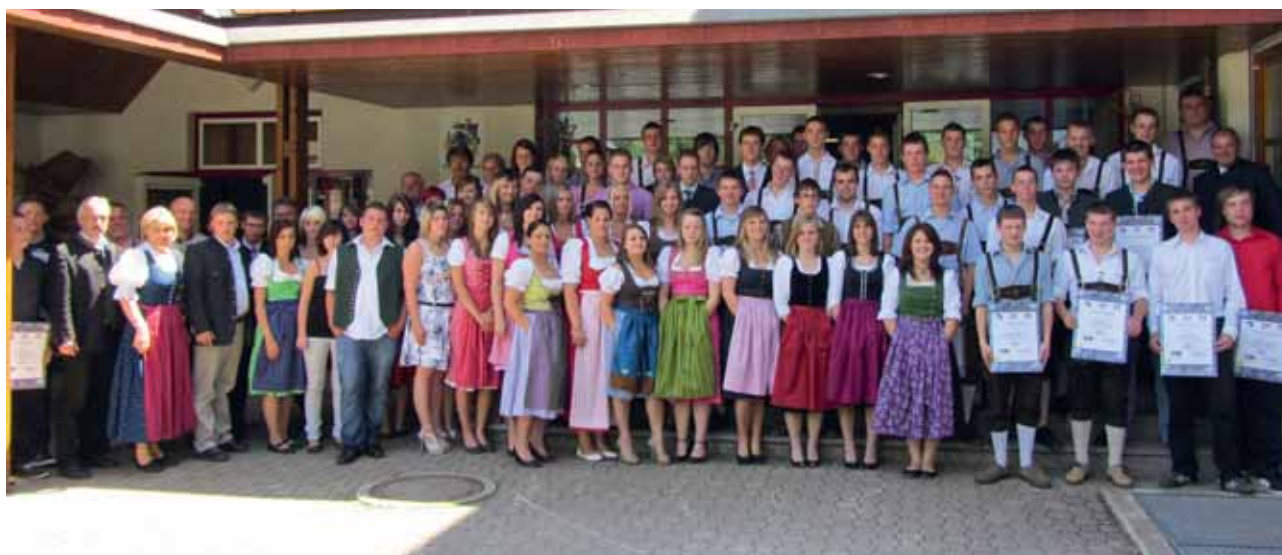
Alle Absolventen 2011