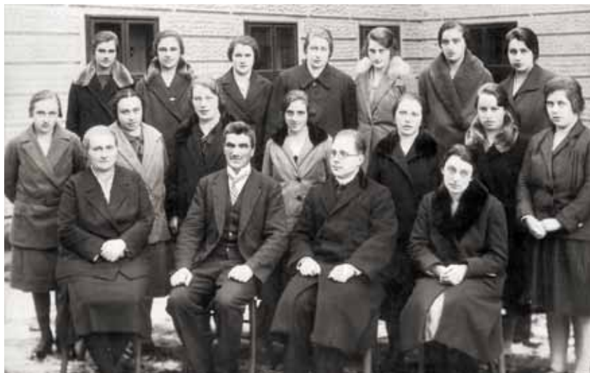
7. Abschlussjahrgang Mädchen, 1930/31