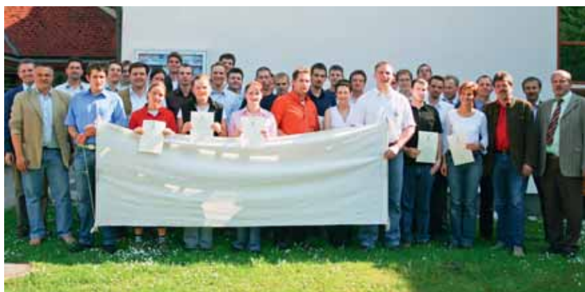
BBS LW 2006/07