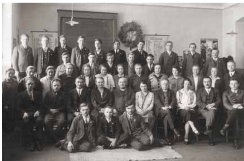
Beide Abschlussjahrgänge gemeinsam, 1928/29