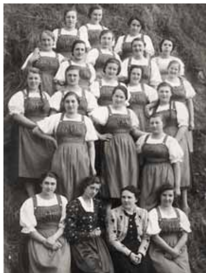
15. Abschlussjahrgang Mädchen, 1938/39