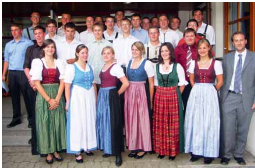
Abschlussjahrgang LW 2008