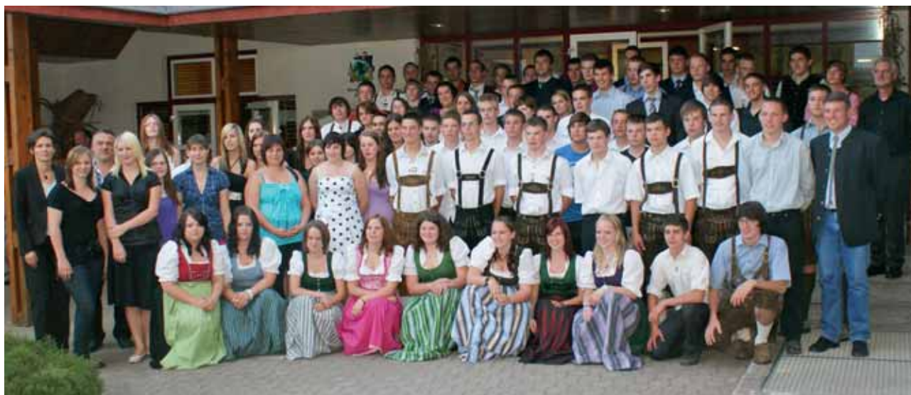
Alle Absolventen 2010