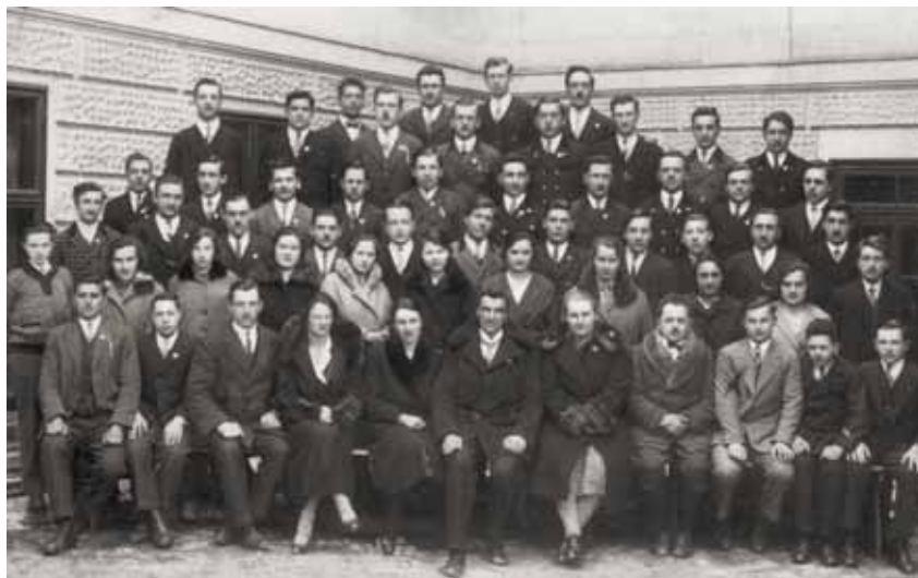
Alle 1. u. 2. Jahrgänge Burschen und Mädchen, 1931/32