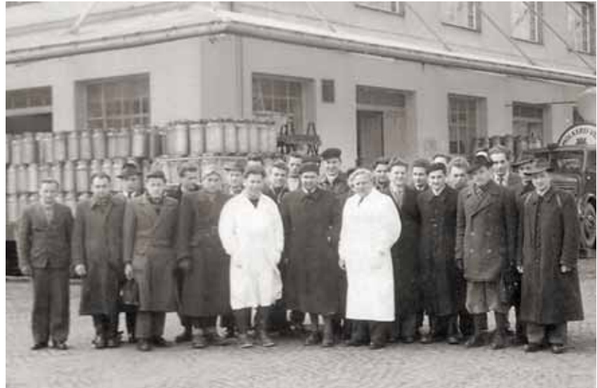
Abschlussjahrgang und 1. Klasse 1956