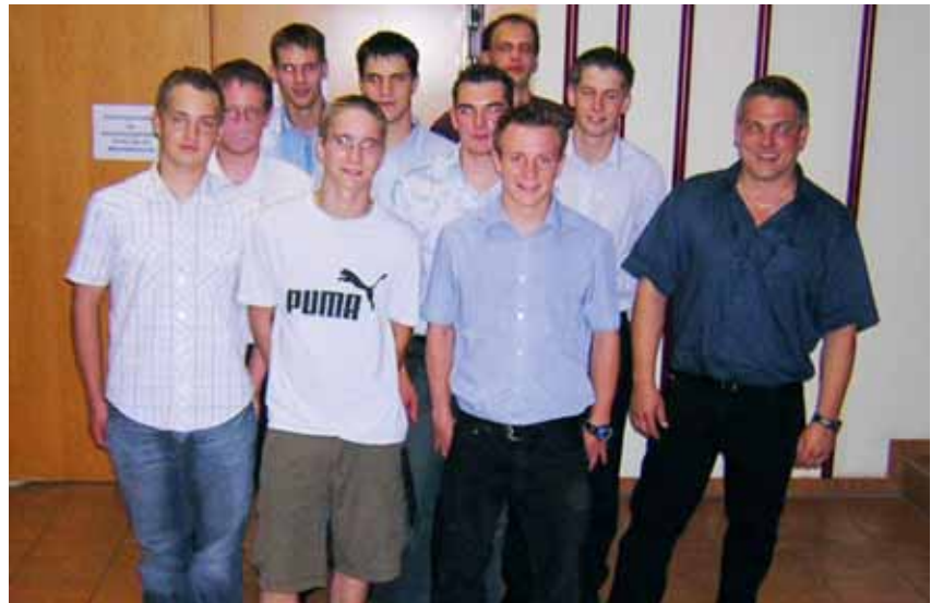
Die ersten Metaller, 2005