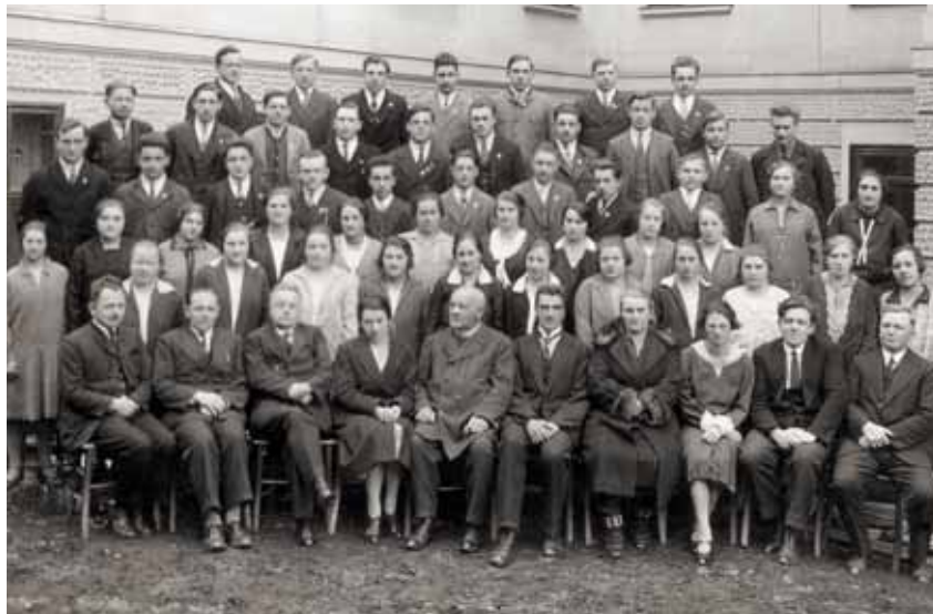
Beide Abschlussjahrgänge gemeinsam, 1929/30