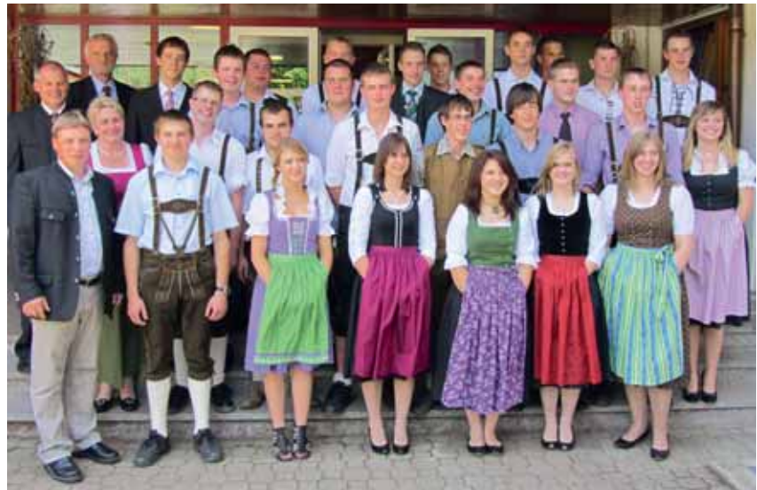
Abschlussjahrgang LW 2011