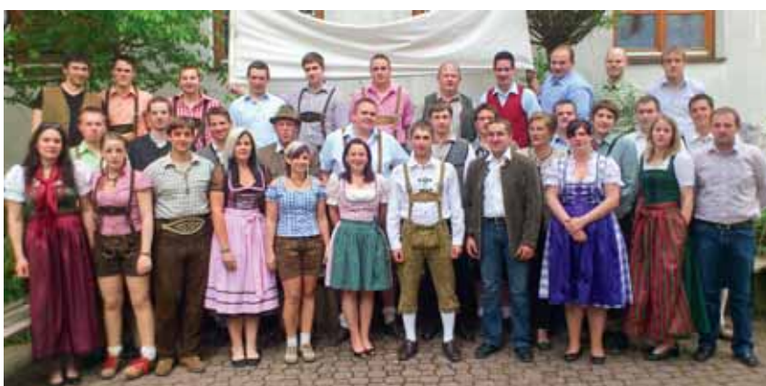
BBS LW 2011/12