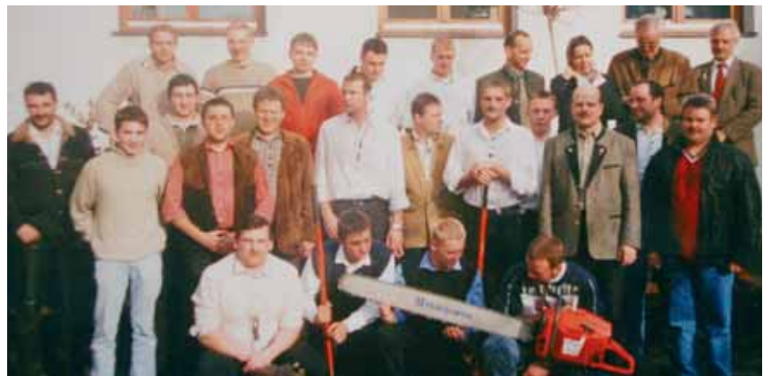
BBS Forst 2003/04