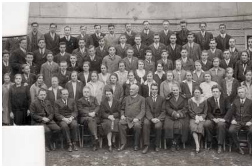
Alle 1. u. 2. Jahrgänge Burschen und Mädchen, 1929/30