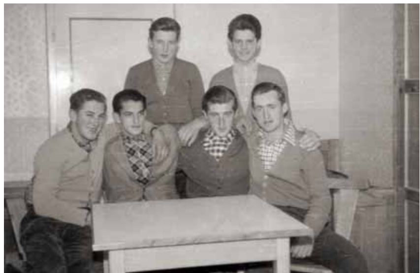
Absolventen und Zimmerkollegen, 1960