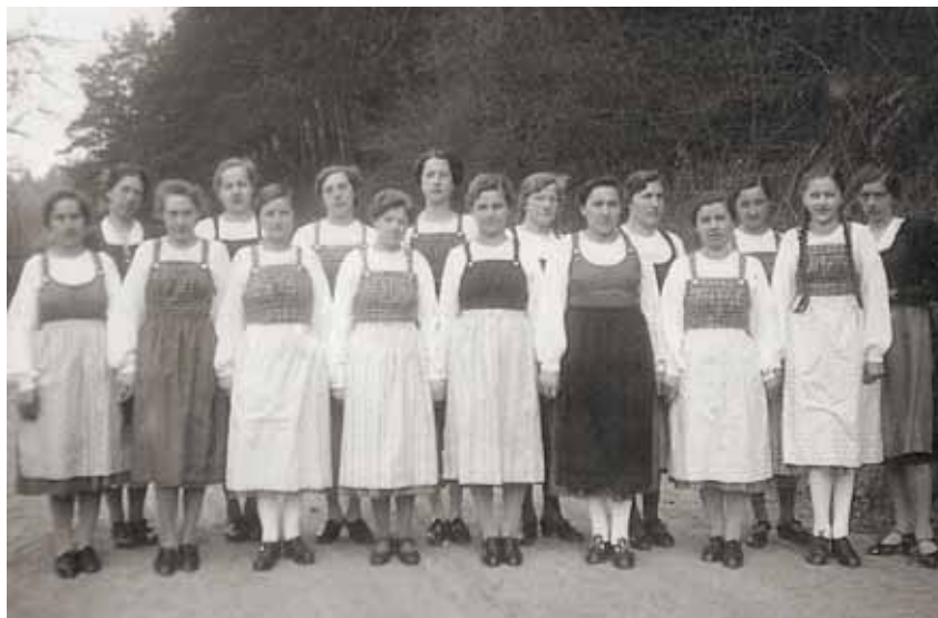
16. Abschlussjahrgang Mädchen, 1939/40